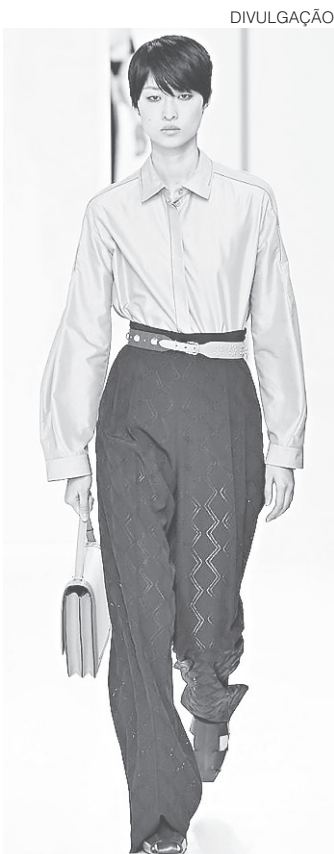
Desfile em Paris: Coleção Verão 2018 Hermès

Está em votação para consulta pública no canal E-cidadania, no portal do Senado Federal, o Projeto de Lei 97/2017, da Câmara dos Deputados, que limita o uso de carros oficiais e que os destina uso nas áreas de segurança pública, saúde e educação. Por enquanto, a maioria dos votos é favorável ao projeto. E qualquer pessoa pode opinar no site enquanto a matéria tramita no Senado.