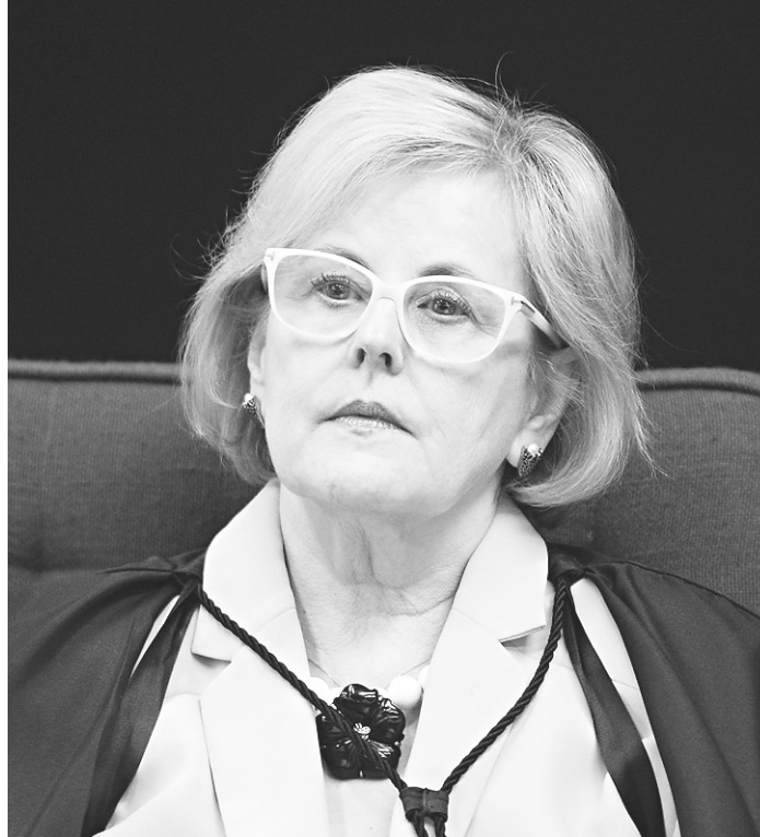
// Rosa Weber quer portaria julgada no pleno do Supremo

“A conceituação restritiva presente no ato normativo impugnado divorcia-se da compreensão contemporânea [sobre o trabalho escravo], amparada na legislação penal vigente no país, em instrumentos internacionais dos quais o Brasil é signatário e na