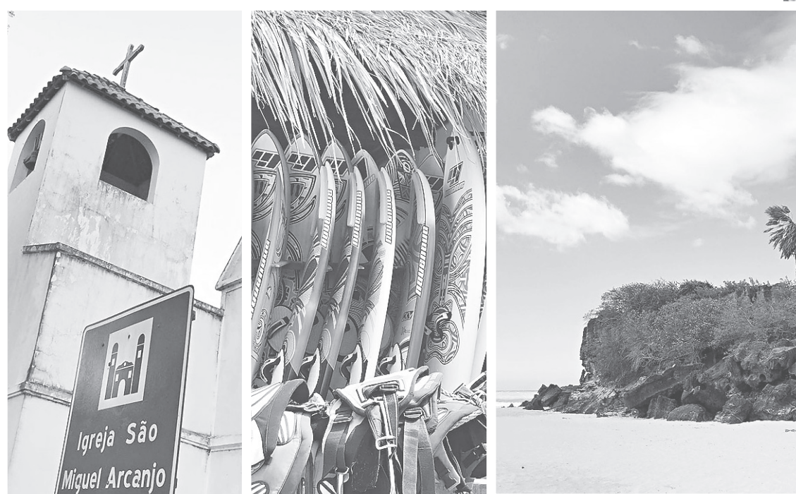
A igreja linda, o vento ameno, a visão do Tartuga: tudo encanta em Gostoso