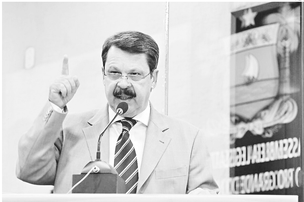
// Deputado foi beneficiado por precedente aberto pelo STF no caso envolvendo o senador Aécio Neves