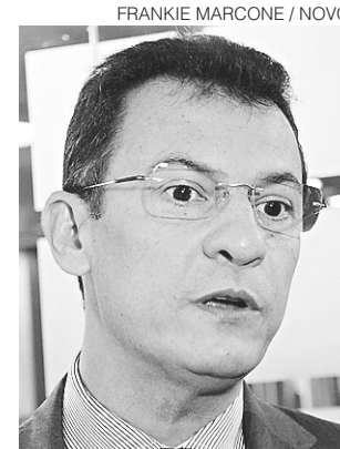
// Deputado é acusado de improbidade administrativa

O desembargador reforçou à época que "a suspensão do exercício da função pública do parlamentar, em si, não significa, nem de longe, um adiamento do mérito da acusação, tampouco importa em antecipação de condenação do requerido". Essa medida, acrescenta o magistrado na decisão, não constitui novidade no ordenamento jurídico, pois existem precedentes do STJ no mesmo sentido. A gravidade concreta da conduta da qual o investigado é acusado embasou a decisão. O julgador rejeita que a determinação representa violação à imunidade parlamentar prevista no artigo 38, § 1º, da Constituição Estadual.