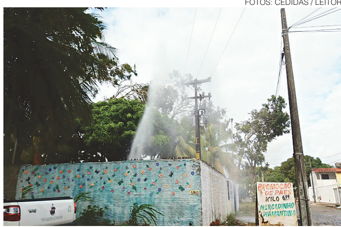
// Jatos de água passaram da fiação, na Rua Diamantina, em Pirangi

Outra tubulação da Caern se rompeu na madrugada desta terça-feira (24) na subestação da distribuidora locali-