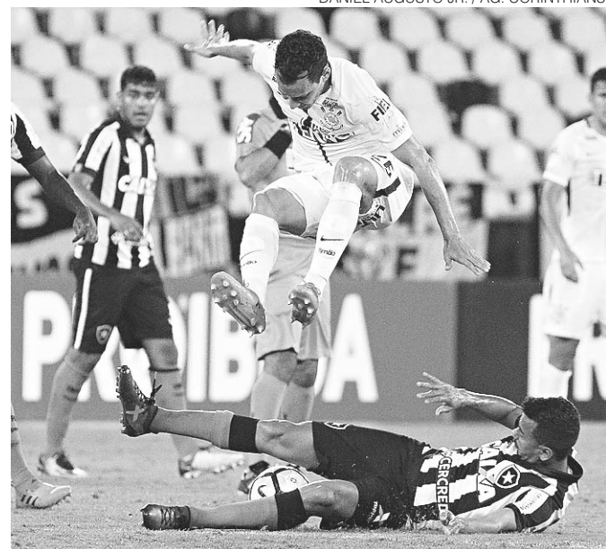
// Projeção foram divulgadas pelo site 'Chance de Gol'

Uma decisão sobre a sede de 2026 será tomada em maio de 2020, ainda que os norte-americanos queiram antecipar uma votação. Para 2030, a decisão poderia ser tomada em quatro anos, ou seja, um ano antes da realização da Copa do Mundo do Catar.