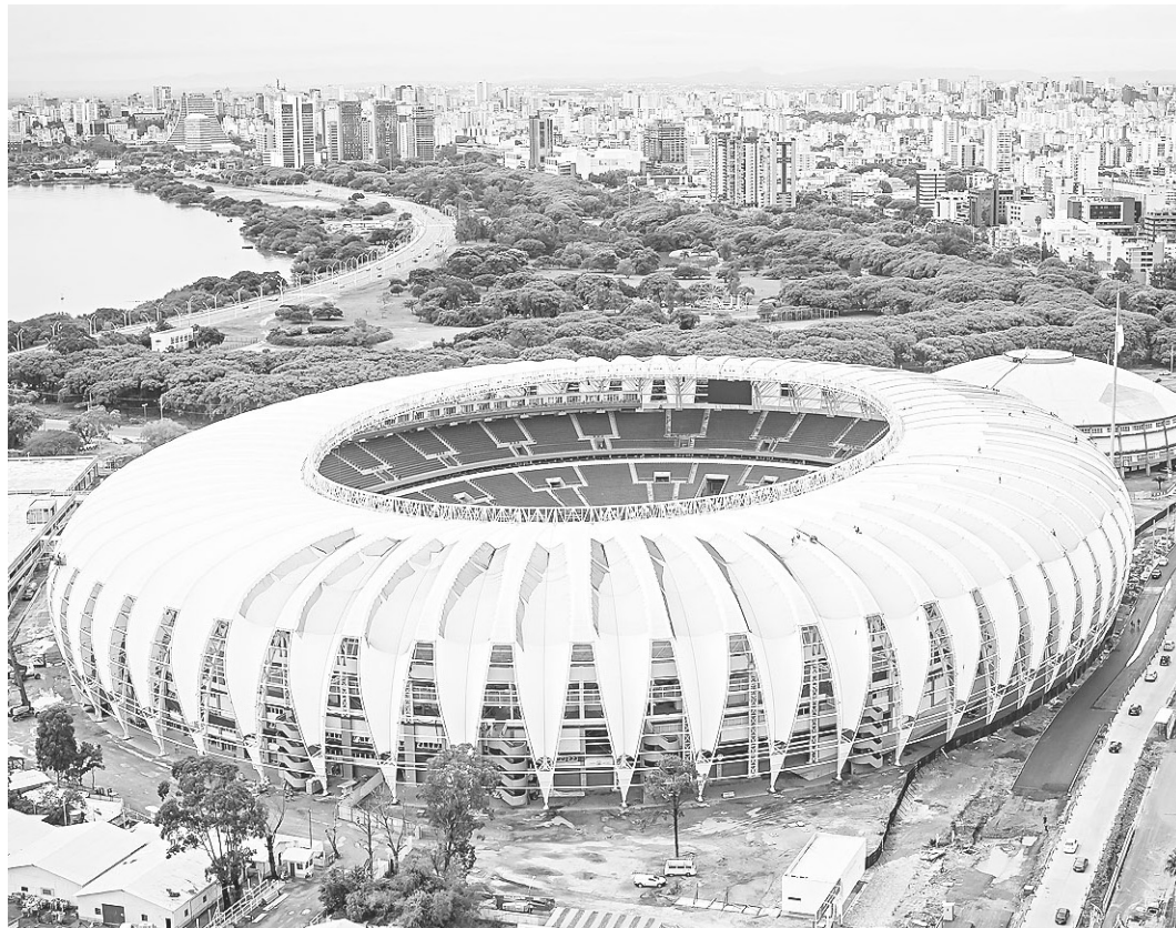
// Jogos seriam concentrados na região Sul do país, dada a proximidade com Uruguai e Argentina

A reportagem apurou que entre integrantes da cúpula da Conmebol existe a ideia de que o Sul do Brasil poderia ser envolvido no projeto. Entre os cenários sob debate de alguns dirigentes estão o uso de campos de treinamento e bases para seleções ou até mesmo estádio para algumas partidas da primeira fase, ajudando a reduzir a pressão sobre o número limitado de arena nos três países.