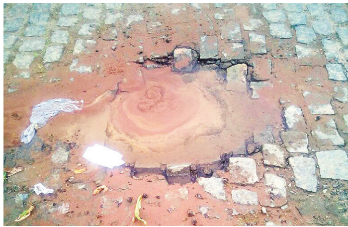
// Rua Alto Santa, no Panatis II: vazamento de água potável

ma. Moradores relataram que haviam telefonado várias vezes para o atendimento da Caern após o rompimento da tubulação, entretanto, as chamadas não foram atendidas.