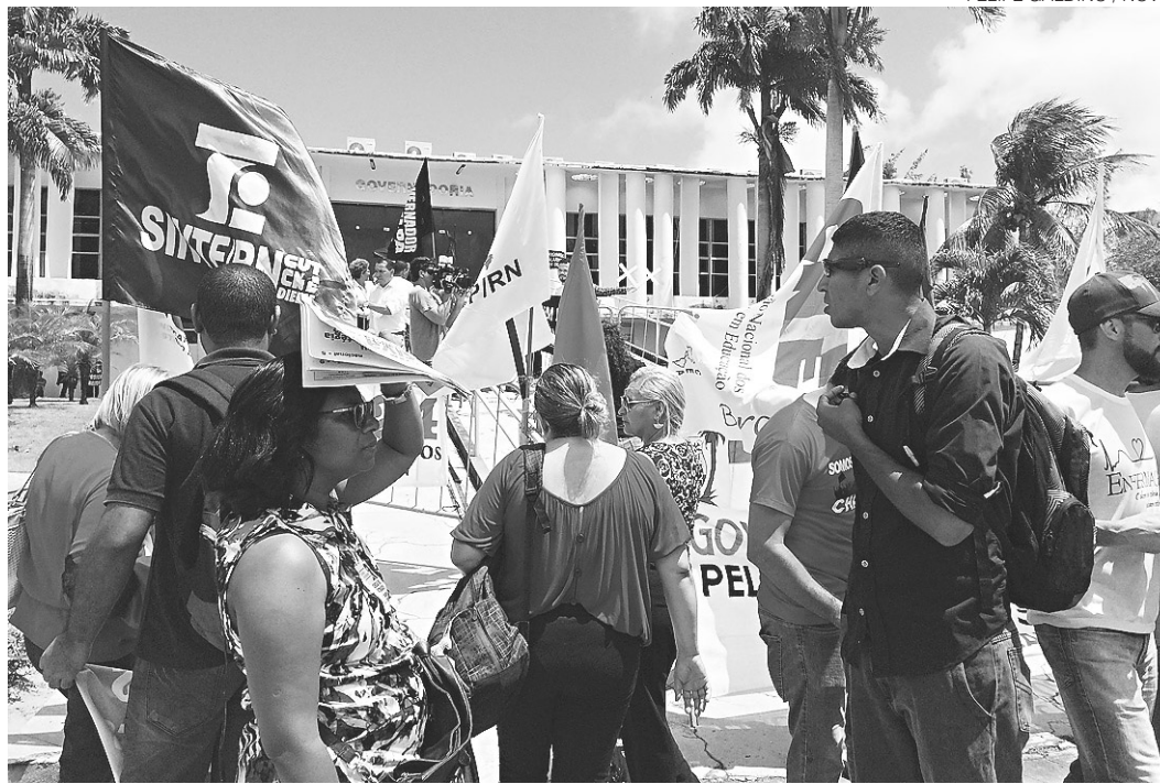
// Dia Estadual de Luta e Paralisação reuniu manifestantes no Centro Administrativo do estado

O que inflamou ainda mais os servidores foi o pacote de medidas de ajuste fiscal enviado na semana passada à Assembleia Legislativa pelo