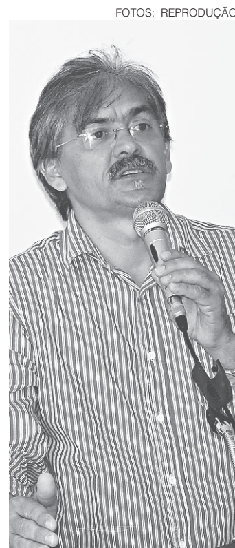
// Secretário Canindé França destaca importância do projeto

A Secretaria de Esportes ainda prevê realizar um grande seminário para discutir o esporte como um todo no estado. O evento deve ser realizado em maio, em Natal.