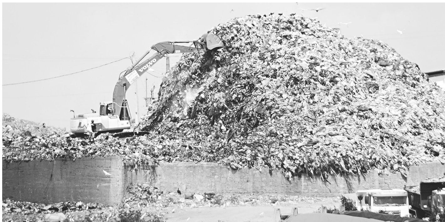
// Estação de transbordo de Cidade Nova, Zona Oeste da cidade: lixo acumulado chegou a quatro mil toneladas