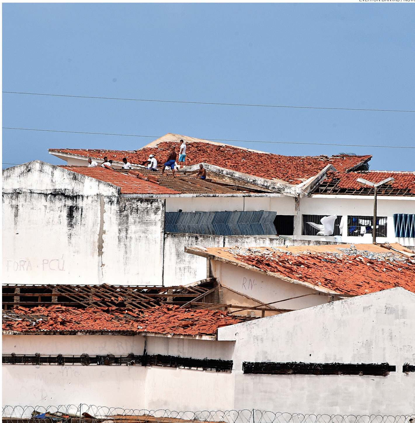
// Direção diz não ter qualquer controle ou restrição de acesso dos apenados entre os pavilhões após a crise iniciada no dia 14 deste mês