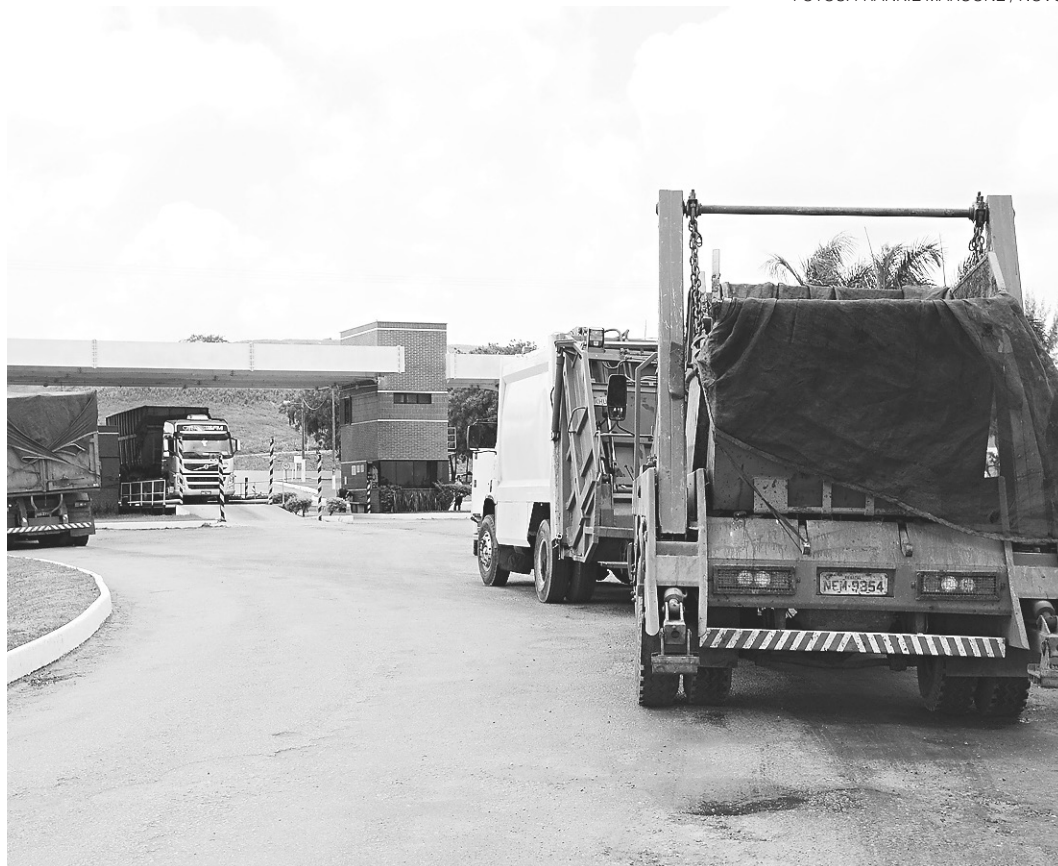
// Aterro sanitário metropolitano de Ceará-Mirim recebe diariamente até 750 toneladas de lixo de Natal

“Como só havia um compressor para toda a demanda,