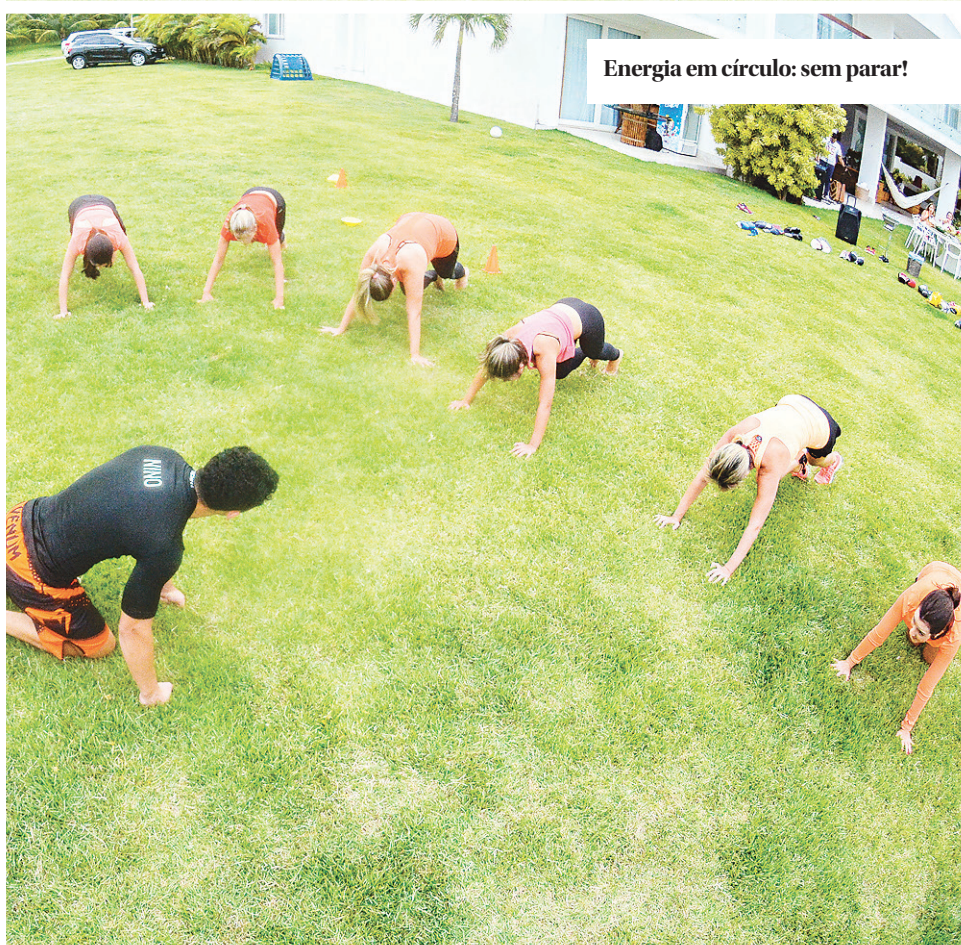
Energia em círculo: sem parar!