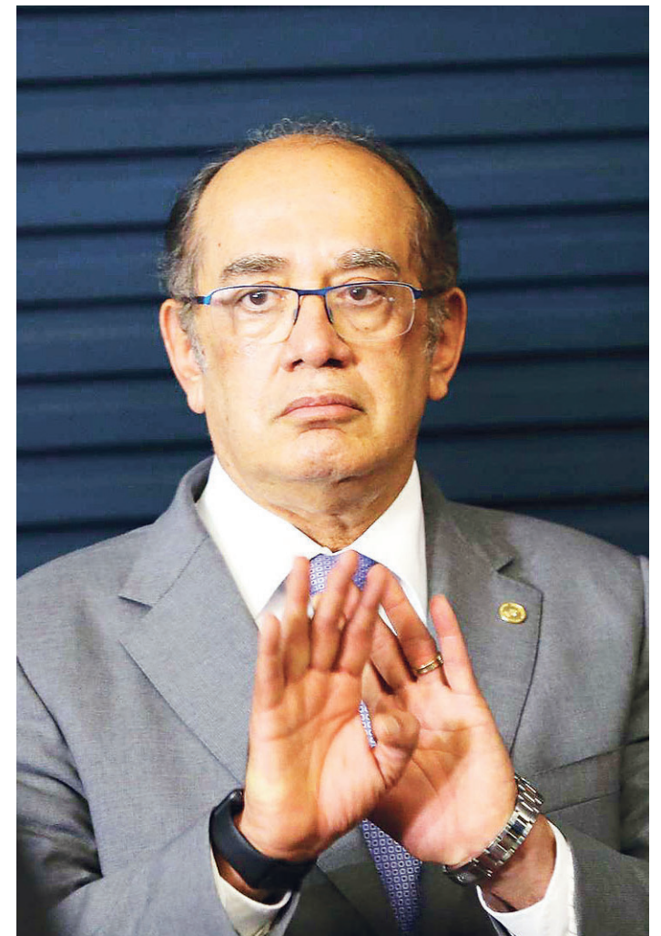
// Gilmar Mendes, ministro do STF: “Isso tumultua a vida de todos”

Na avaliação de Gilmar, “ninguém deseja ser relator da Lava Jato”. Ele lembrou uma passagem envolvendo os ministros Luís Fux e Teori Zavascki. Certa vez, Barroso disse a Teori