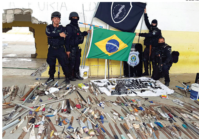
// Também foram recolhidas armas brancas e outros objetos

De acordo com as informações repassadas pelo Governo do Estado, 120 detentos que portavam material ilícito foram encaminhados para