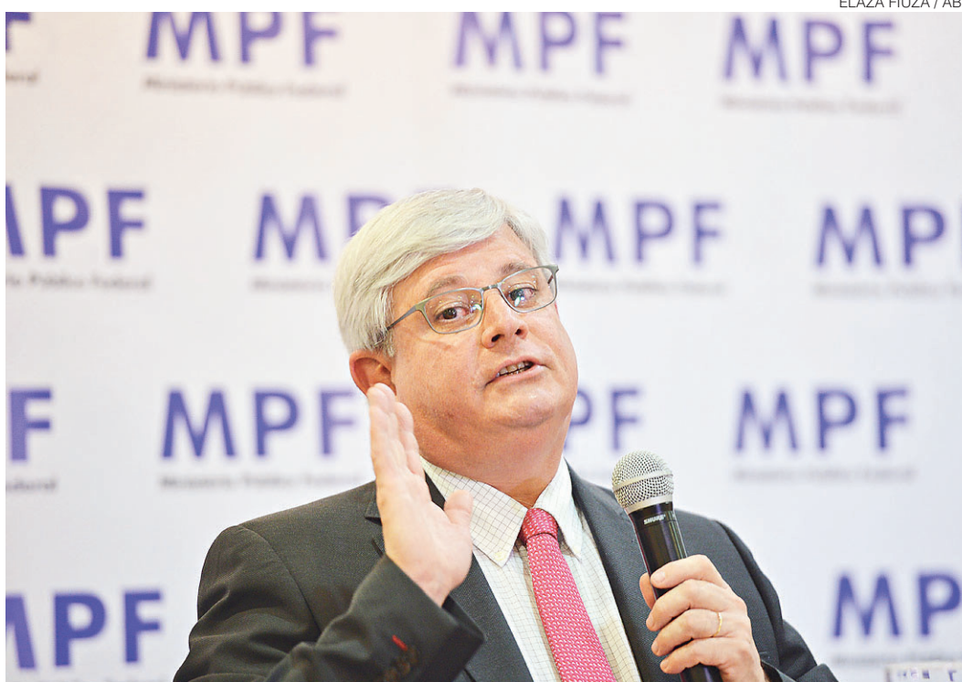
// Rodrigo Janot, da PGR, é contra Supremo Tribunal Federal conhecer ação contra a PEC da Previdência

O parecer foi enviado na Arguição de Descumprimento de Preceito Fundamental (ADPF) 438, ajuizada pela Confederação Nacional dos Trabalhadores na Indústria Química (CNTQ), a Federação dos Empregados de Agentes Autônomos do Comércio do Estado de São Paulo (Feaac) e o Sindicato Nacional dos Aposentados Pensionistas e Idosos da Força Sindical (Sindnapi). Nele, o procurador analisa apenas questões formais e técnicas do processo, sem entrar no mérito do pedido.