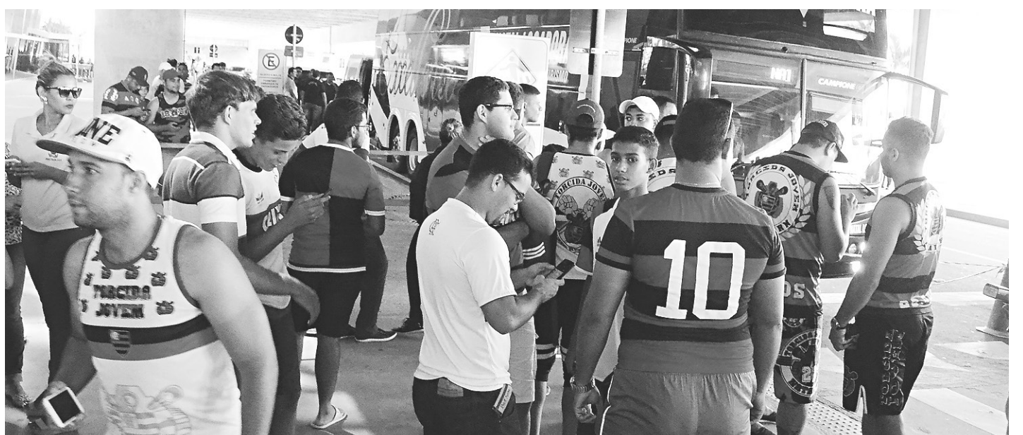
// Pequeno grupo de torcedores do time carioca compareceu ao aeroporto ontem para acompanhar o desembarque rubro-negro