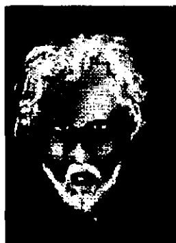
(figura 21 – “Auto Retrato”)