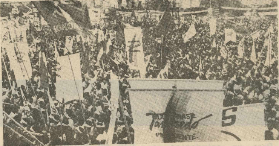
A multidão ocupa a Praça Cívica em Goiânia.

tórios e bibliotecas deficitárias, sem financiamento para as pesquisas, etc.