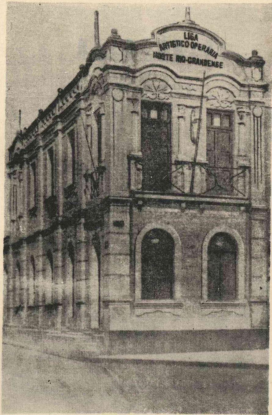
Sede Própria: Av. Rio Branco, 621 - 1.º and. - Natal - RN