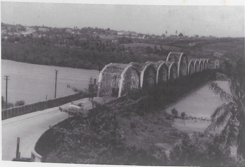
FOTO 4 – A Ponte antiga de Igapó. Destaque para a margem esquerda do Rio Potengi. Fonte: Miranda, João Mauricio F. Evolução Urbana de Natal em 400 anos: 1599 – 1999. volume 7. p. 59.