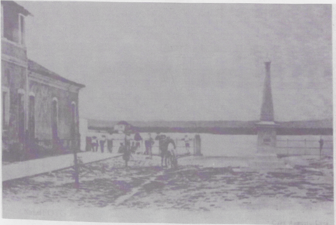
FOTO 1 – Cais Tavares de Lyra. Veja o fundo, do outro lado do rio Potengi, o início do povoado da “Corôa”.