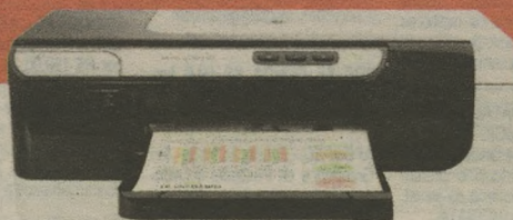
IMPRESSORA HP OFFICEJET PRO 8000 Ciclo de trabalho: Até 15000 páginas

ECONOMIZE DE: 468,90 83,90 POR: 385,00 em 6X 64,17 sem juros