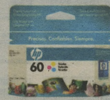
CARTUCHO HP CC643WL Nº60 COLOR 47,90 à vista

www.miranda.com.br | Entrega em domicílio: Natal 3342.1000 | Mossoró 3064.2000