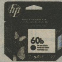
CARTUCHO HP CC636WL Nº60B EVERYDAY PRETO 24,90 à vista