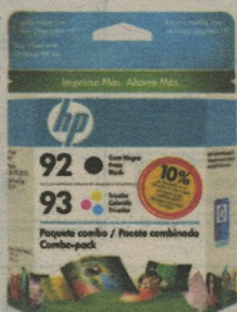
CARTUCHO HP C9513FL Nº92/93 COMBOPACK 88,90 à vista