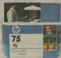
CARTUCHO HP CB337W Nº75 COLOR 47,90 à vista