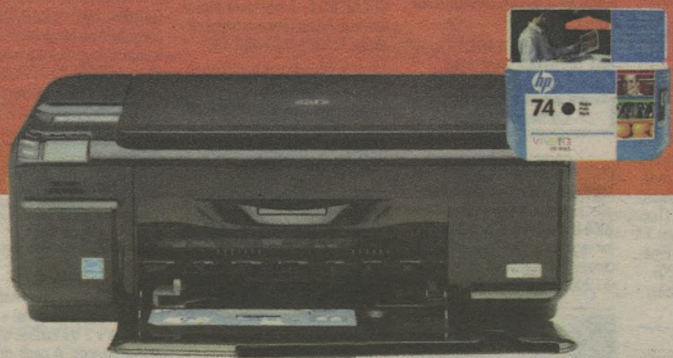
MULTIFUNÇÃO HP PHOTOSMART C4480 Impressora, copiadora e scanner + CARTUCHO HP 74 PRETO

ECONOMIZE DE: 468,90 83,90 POR: 385,00 em 6X 64,17 sem juros