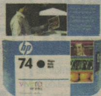
CARTUCHO HP CB335W Nº74 PRETO 39,90 à vista