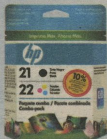
CARTUCHO HP C9509FL Nº21/22 COMBOPACK 81,90 à vista