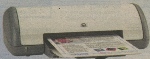
IMPRESSORA HP DESKJET D1560 Super compacta 149,00 à vista