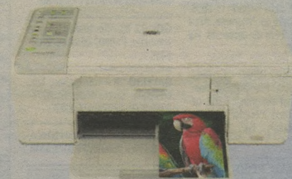
MULTIFUNÇÃO HP DESKJET F4280 Impressora copiadora e scanner 299,00 à vista