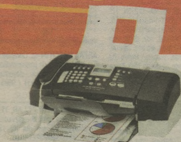
MULTIFUNÇÃO HP OFFICEJET OJ3680 Impressora, copiadora, scanner e fax

ECONOMIZE DE: 599,00 150,00 POR: 449,00 em 6X 74,83 s/ juros