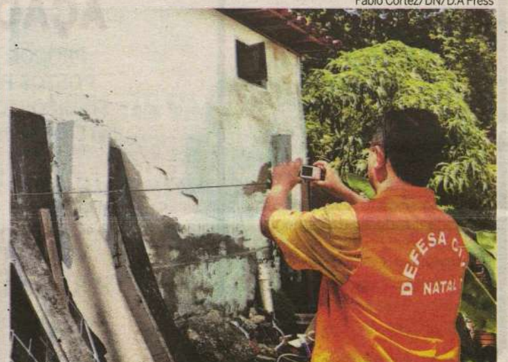
Imóveis estão localizados em encostas e correm risco de desabamento

Durante toda a tarde desta quarta-feira as equipes da Defesa Civil estarão realizando rondas e atendendo a ocorrências relacio-