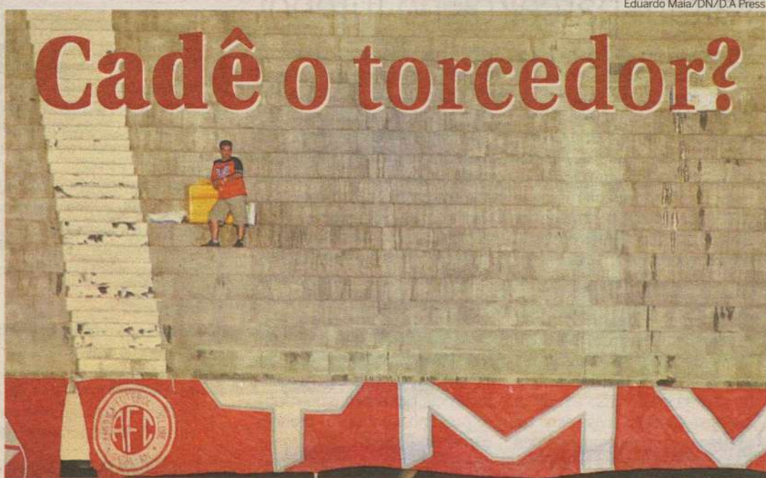
Número de pagantes no último jogo, contra o Alecrim, foi de apenas 551 pagantes, no estádio da Lagoa Nova

A ausência do torcedor americano no Machadão é decepcionante. No último jogo contra o Alecrim, foram registradas apenas 551 pagantes, gerando uma renda de apenas R$ 7.650,00.