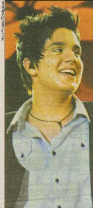
No show, cantor lançará duas novas músicas, Um beijo e Amar não é pecado

Viajando por todo o Brasil para mostrar seu novo trabalho, Luan leva para estrada um espetáculo de luzes, som e efeitos especiais com uma grande produção, digna de um grande artista, que o Brasil já começa a conhecer, através do inconfundível timbre de voz e pelo carisma que tem no palco. Luan Santana participa de grandes eventos sertanejos como Caldas Country, Festa do Peão de Barretos, além das principais Festas de Peão e Exposições Agropecuárias de todo Brasil. A agenda de Luan Santana fechou o ano de 2009 com 300 shows realizados pelo Brasil, com média de 25 apresentações por mês, ele leva até seu público, um grande espetáculo porque Luan Santana se dedica a fazer o que ele mais gosta: cantar.