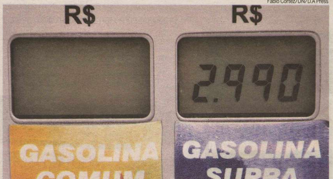
Em muitos postos de Natal, o litro de gasolina chegou a R$ 3, provocando mobilizações sociais e institucionais

Através do perfil @combustiveisrn, o Sindicato está conversando, no Twitter, com os consumidores e tirando dúvidas. No site, o Sindipostos dá explicações sobre como é formado o preço da gasolina, as razões do aumento e de como alguns postos vendem mais