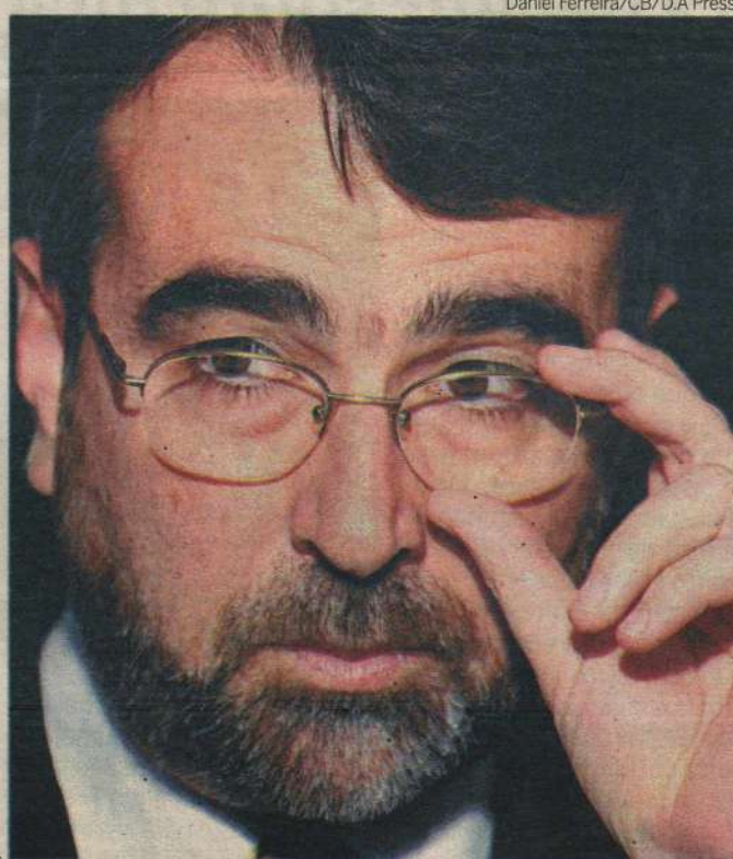
Daniel Ferreira/CB/D.A Press

Ele também anunciou a realização de um ato de apoio à proposta de reforma política. O evento está previsto para a próxima terça-feira, véspera da votação do relatório final na comissão. Devem participar do ato representantes de diversas entidades como a Ordem dos Advogados do Brasil (OAB), a