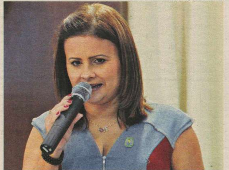
Prefeita tem evitado falar em política, mas deve admitir candidatura

O evento será realizado pela Fundação Verde Hebert Daniel e terá dois momentos. O primeiro será voltado para a formação política dos participantes, com palestras e discussão de projetos para o futuro. O segundo momento focará as discussões no processo eleitoral de 2012. De acordo com o diretório estadual, o Partido Verde espera deliberar candidaturas próprias na maioria dos municípios do Estado.