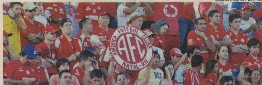
Seis mil torcedores alvirrubros são esperados no Nazarenão para o primeiro jogo do América em casa pela 2ª fase da Série C