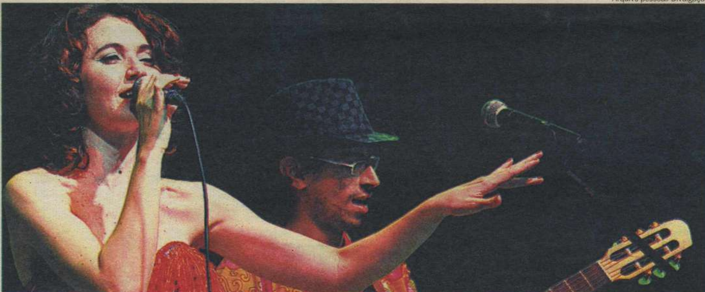
Toque mais que feminino: trabalho da paraense consiste na observação de mulheres de vários países, mas especialmente na participação de conterrâneas