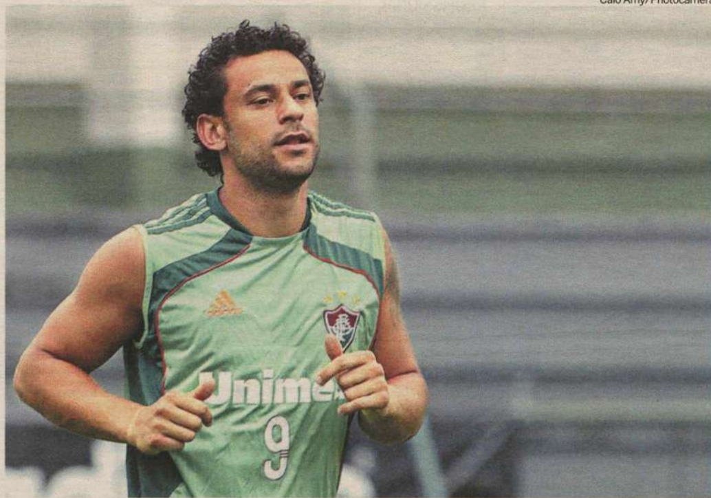
Com a saída de Conca para o futebol chinês, atacante virou o principal jogador do Tricolor das Laranjeiras

"Será um dia mais do que especial para mim, completando cem jogos pelo Fluminense, mo-