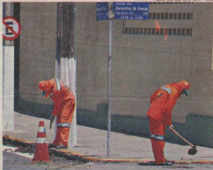
Empresas alegam que não recebem nada pelo serviço e precisam demitir

Maiara Felipe maiarafelipe.rn@dabr.com.br