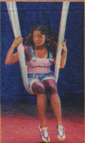
Em cartaz hoje e amanhã, peça inspira-se em obra de Ana Maria Machado