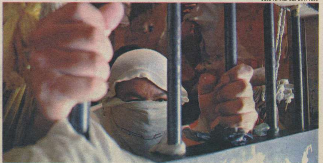
Medida é provisória e uma reunião com representantes da Corregedoria e Secretaria de Justiça está agendada para terça-feira

Porém, o magistrado deixa claro que não se trata de proibição porque é uma medida provisória, além de que existem exceções que devem ser levadas em consideração. "Podem ser recebidos presos já condenados pela justiça ou que estão no sistema aberto ou semi-aberto, porém é necessário ter au-