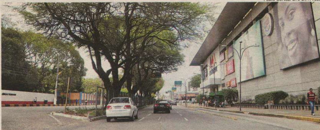
Plantação das novas árvores ocorreria na altura do Walfredo Gurgel para possibilitar construção de passarela