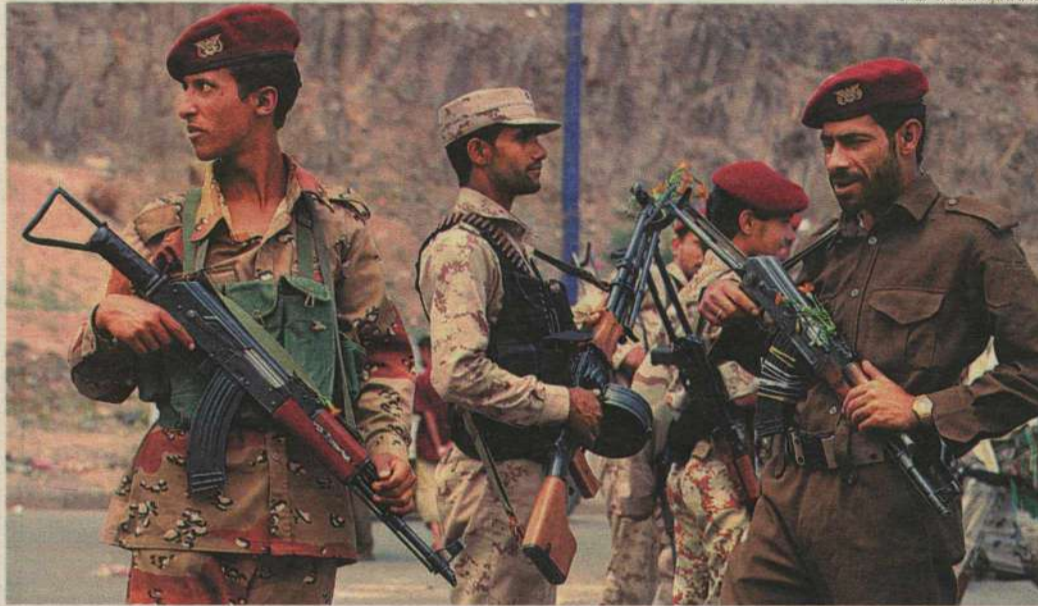
Soldados redobram a segurança depois do ataque americano que matou al-Awlaki

Com sua veemência e discurso poético, enraizado na tradição dos primeiros tempos do Islamismo,