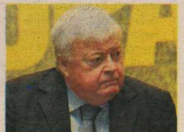
Quadro de Teixeira segue estável