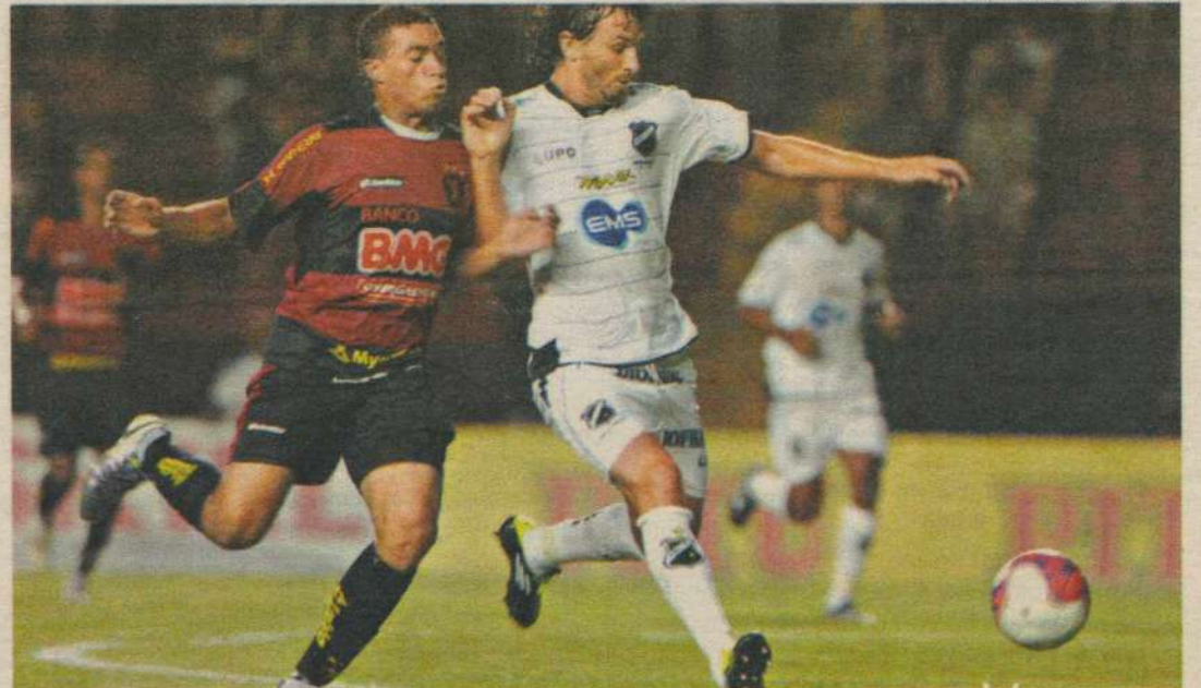
Leão bateu o Alvinegro na Ilha do Retiro por 2 a 0 no jogo da ida

Em 43 anos de confrontos entre as duas equipes, ABC e Sport já se enfrentaram 17 vezes e o time pernambucano leva vantagem em cima do Alvinegro. São 11 vitórias do Leão, contra duas do time de Natal e quatro empates. No primeiro turno, no Recife, o Sport venceu por 2 a 0.