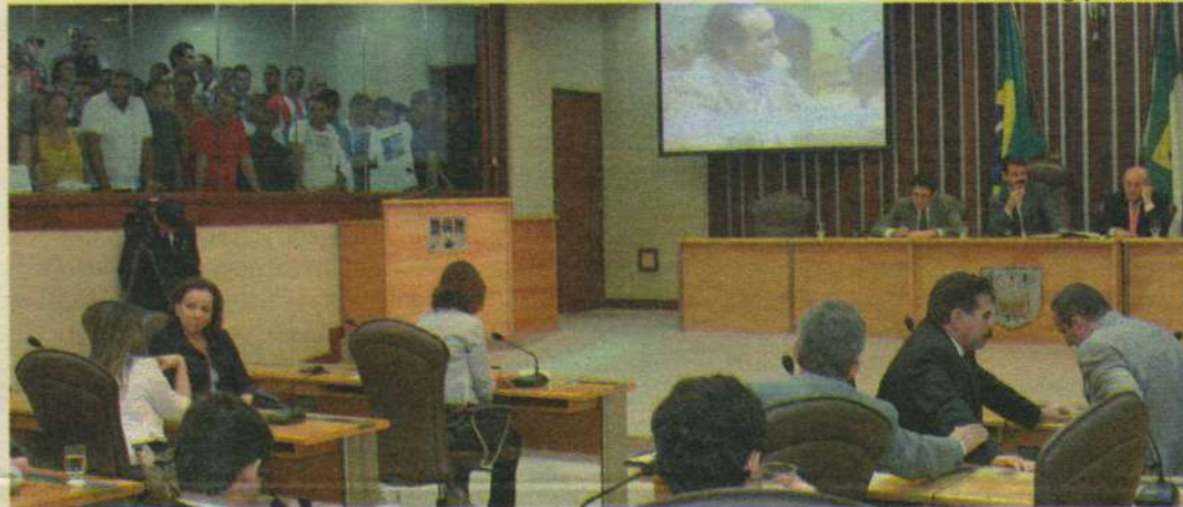
Numa sessão prolongada, deputados aprovaram ontem pedido de empréstimo do governo para obras de infraestrutura

Antes, os parlamentares rejeitaram, por 16 votos a 8, o projeto substitutivo apresentado pela Comissão de Constituição, Justiça e Redação (CCJ) da Casa, com mudanças no rateamento