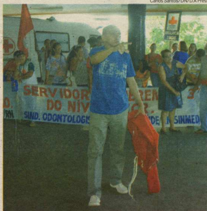
Categoria realizou protesto no Walfredo Gurgel para cobrar série de reivindicações