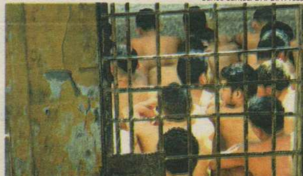
85 detentos dividem o espaço que deveria abrigar máximo de 50