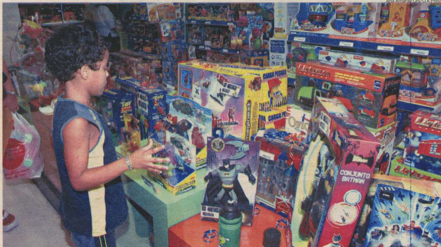
Lojas estarão abertas ao público em diversos pontos da capital para quem ainda não comprou o presente do filho, neto, sobrinho, afilhado ou primo

O comércio de rua, este ano, apresenta novidades. A abertura, como sempre, é facultativa e está prevista para ocorrer entre os horários das 9h às 15h. No Alecrim, é possível que algumas lojas, principalmente de artigos para as crianças, estejam funcionando. Já no Centro da Cidade, mesmo com a abertura facultativa, as grandes lojas como a C&A (9h às 18h), Riachuelo (8h às 16h) e Lojas Americanas (9 às 16h) estão funcionando com horários diferenciados.