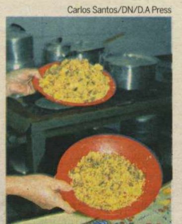
Em diversas unidades de ensino, boa parte da merenda vai parar no lixo

"O recurso do PNAE se destina apenas à alimentação escolar dos alunos matriculados na rede pública e o Estado não repassa aos Cais Escolares recursos destinados à alimentação de servidores públicos e trabalhadores terceirizados lotados nas escolas estaduais", destaca, reforçando que a medida é para evitar o desperdício e uso indevi-