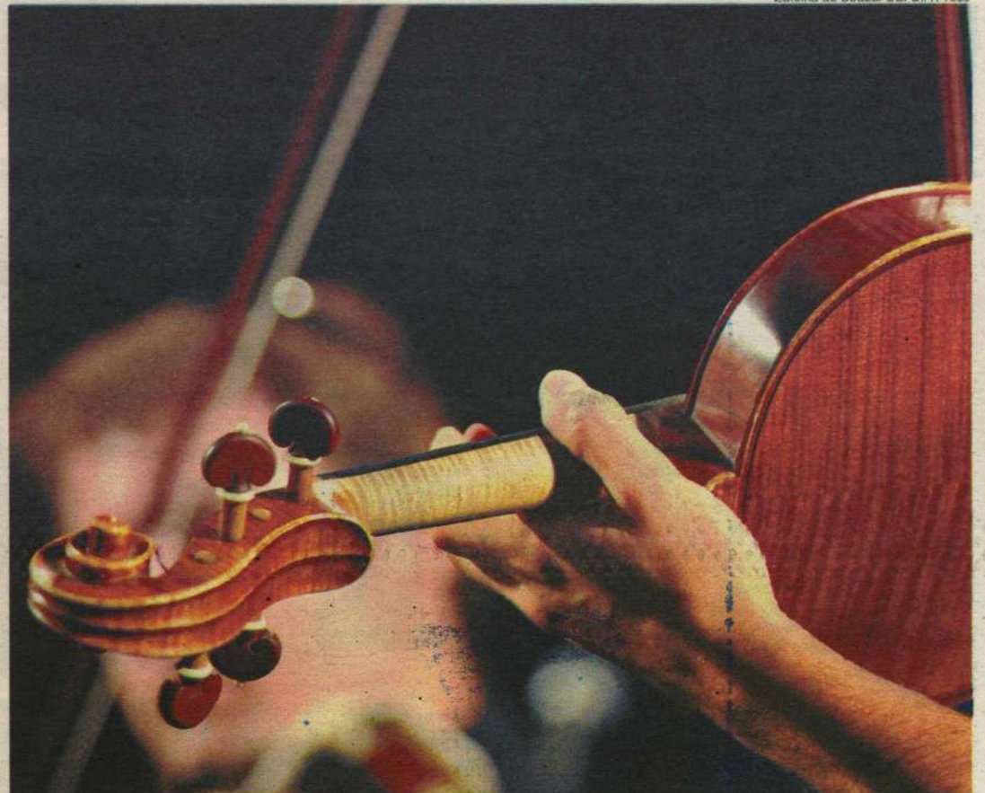
Percussão, chorinho, jazz, música contemporânea e clássica soam em seis espaços simultâneos do bairro histórico