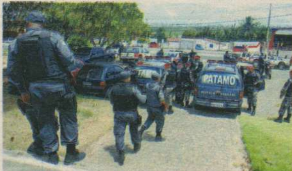
Batalhão de Choque cercou entorno do CDP da Zona Norte