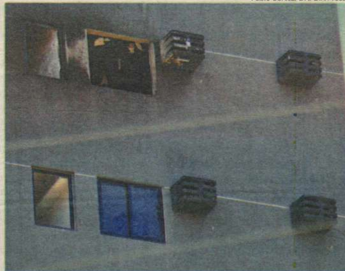
Após susto, moradores estão autorizados a retornar a seus apartamentos

Durante o trabalho dos bombeiros no Alto do Tirol foi constatado o não funcionamento da alta plataforma aérea e falta de máscaras para os bombeiros - um soldado ficou ferido com queimaduras de terceiro grau. Segundo o coronel, a escada não funcionou porque a rua onde fica o prédio é uma ladeira e o equipamento só consegue ser acionado em local plano. A plataforma pode chegar até o 17º andar de um prédio, acima dessa altura, outras normas vigo-