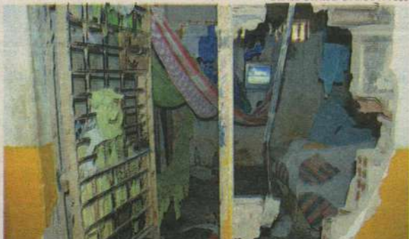
Celas foram arrancadas e paredes derrubadas na unidade