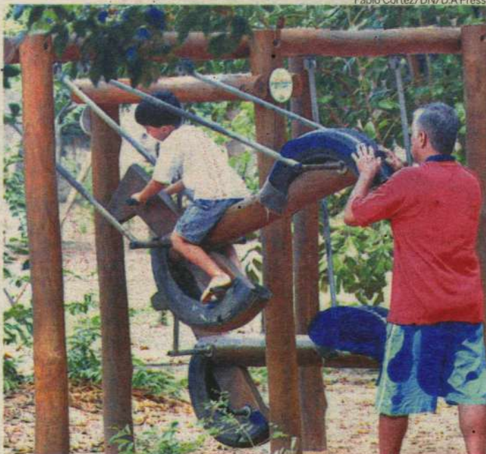
Pai e filho se divertem no Parque das Dunas, uma das alternativas nesta quarta