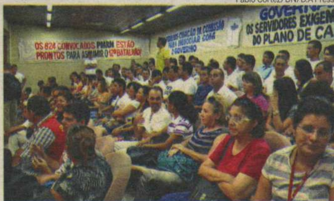
Funcionários públicos querem apoio para pagamento do PCCS

A proposta das categorias em greve a partir de agora é de mudanças nos pagamentos realizados pelo governo aos seus servidores, após as reiteradas afirmações do Governo do Estado de que os planos não podem ser pagos, pois o impacto na folha salarial levaria o estado a ultrapassar o limite de 48,34% de gasto com pessoal, como é previsto na Lei de Responsabilidade Fiscal (LRF). Segundo as categorias, o ideal para o governo seria retirar inativos e pensionistas dos gastos da folha salarial, como já foi feito por out-