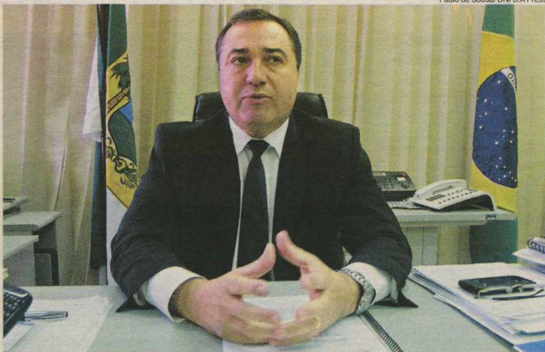
Secretário explica que bandidos potiguares buscam inspiração na facção paulista para amedrontar população