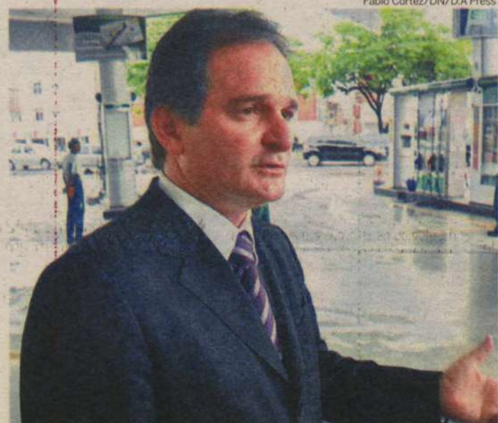
Arakén aguarda realização de concurso público para compor quadro de servidores

Em tempo: o Procon tem a missão de orientar, educar, defender e representar o cidadão. Por enquanto, pelo menos no quesito fiscalizar seus interesses enquanto consumidor, uma representação desproporcional.