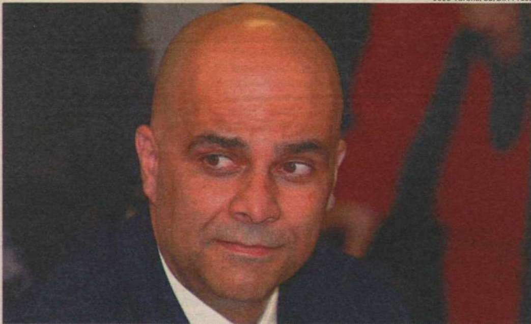
Dentre as acusações, estão transferências milionárias entre contas pessoais da mulher e da 2S Participações

Segundo a denúncia, o Coaf detectou transferências milionárias entre contas da mulher de Marcos Valério e da 2S Participações em diferentes instituições finan-