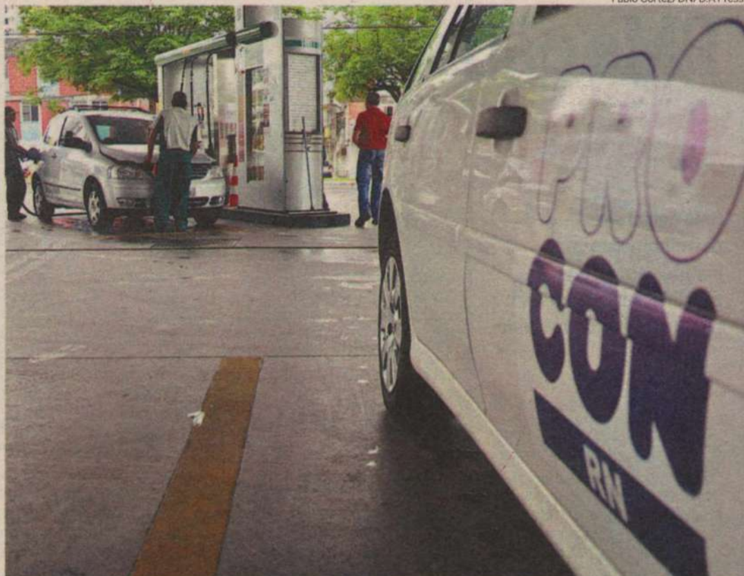
Fiscais se revezam em duplas para dar conta de pelo menos três fiscalizações diárias e 70 mensais, oriundas de 15 municípios

Além dos fiscais, o Procon Estadual precisa ter um quadro próprio de funcionários. Todos os quase 90 servidores públicos que dão expediente no instituto eram lotados em outras secretarias e foram cedidos. A maior parte são funcionários de carreira da Companhia de Processamento de Dados do RN (Datanorte). Diz Arakén Farias: "Já existe uma lei que determina que o Procon terá seu próprio quadro de funcionários". Os 15 fiscais existentes na