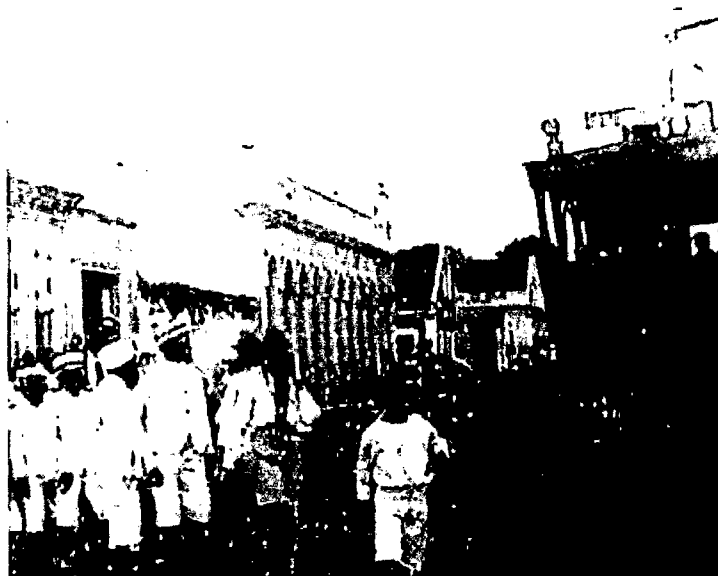
Figura 3: Bonde elétrico que fazia a linha Petrópolis.

Figura emblemática no processo de modernização na capital, o então governador Alberto Maranhão (1908-1914) foi responsável por diversas das obras acima mencionadas, que, de acordo com Monteiro, são o exemplo do exercício do poder pela oligarquia Maranhão, valendo-se das rendas do estado, dos recursos enviados para combater os efeitos das secas e dos empréstimos externos. 12