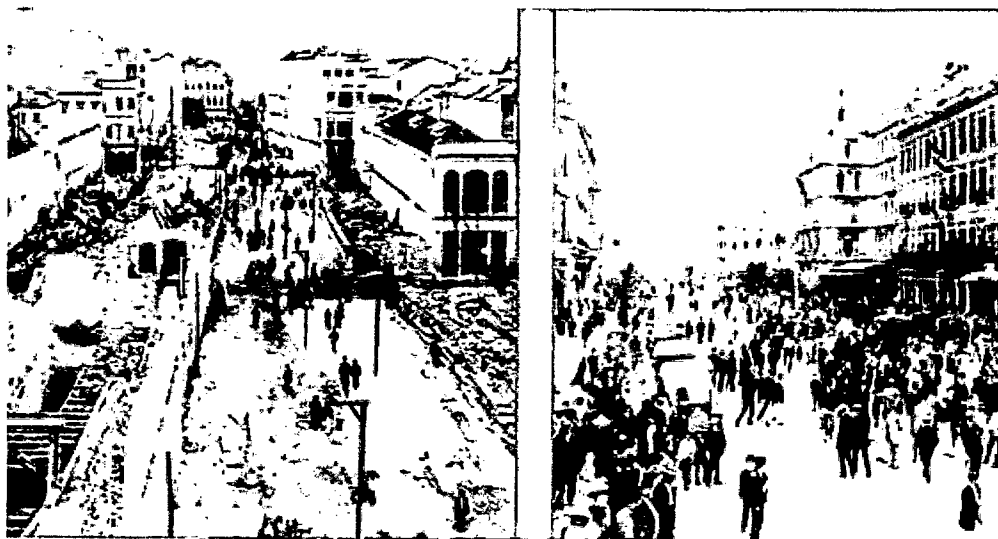
Figura 2: À direita, demolição de casas e prédios para dar lugar à Avenida Central no Rio de Janeiro (1904) À esquerda, a inauguração da avenida, em 1905.

As reformas levadas a efeito em Paris a partir de 1853 produziram uma verdadeira reconstrução de grande parte da cidade, com o alargamento das antigas e estreitas ruas, e conseqüente construção de vias de acesso mais amplas e traçadas de maneira a facilitar a circulação, demolição de casas velhas e insalubres (geralmente de operários ou outros membros da classe mais baixa) para a abertura de avenidas e para a construção de sobrados que passaram a ser habitados por membros da classe superior. Somando-se a isso, houve também a ornamentação da cidade com a construção de jardins, bulevares e monumentos situados de maneira tal que contribuíssem para ressaltar a paisagem da cidade.