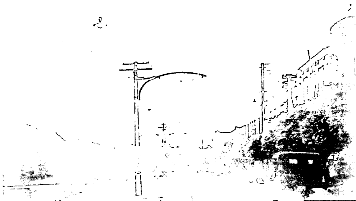
Passeio de automóveis nas ruas da Ribeira, no início do século XX.