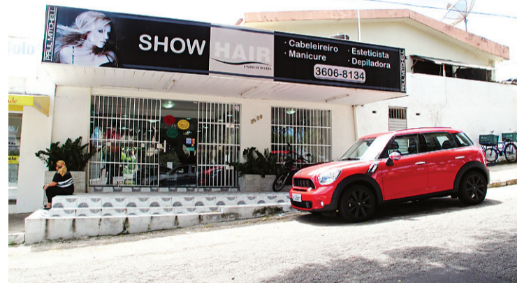
▶ Salão de beleza Show Hair, em Candelária, investigado pela polícia