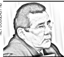
DO DESEMBARGADOR SARANA SOBRINHO NA FESTA DO 80º ANIVERSÁRIO DO TRIBUNAL REGIONAL ELEITORAL.

Sem fazer nada ele está protegido por uma decisão, porém se conseguir superar essas dificuldades e iniciar o atendimento estará sujeito a todo tipo de questionamentos. É assim que o sistema funciona... Ou não!