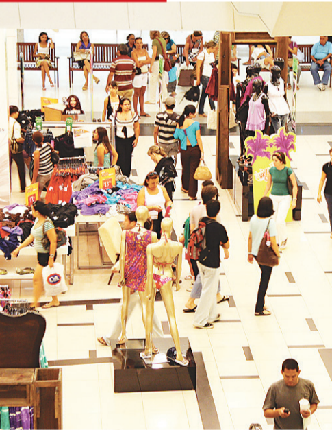
► Comércio distribuirá 4 milhões de cupons

COMÉRCIO DE NATAL INICIA A 3ª MAIOR PROMOÇÃO DO BRASIL