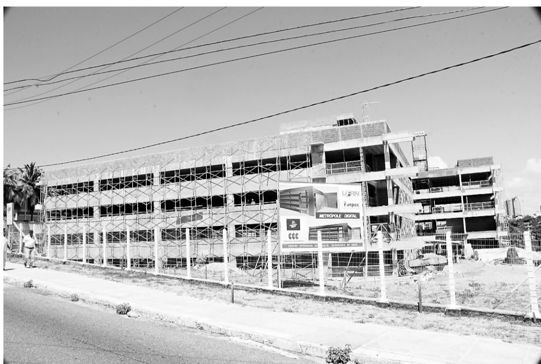
▶ Obras da sede do Programa Metrôpole Digital, no Campus da UFRN, devem ser concluídas em dezembro

O aluno de escola pública recebe ainda uma bolsa de R$ 50. Apesar de o curso ser semi-presencial, o estudante, uma vez por semana, precisa ter uma aula. Esse recurso é para o custeio com passagens.