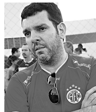
VANESSA SIMÕES / UOL