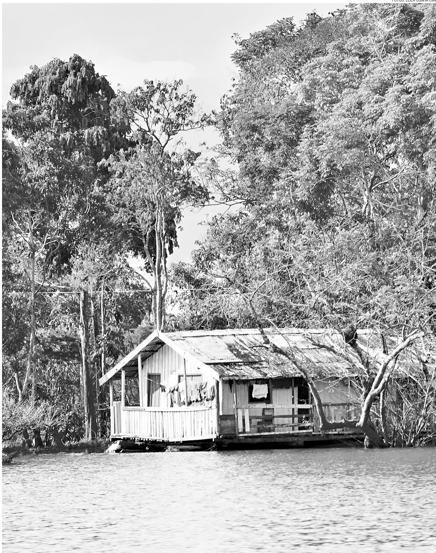
▶ Viagem realizada há dois meses ao Amazonas resultou na exposição de fotografia que será aberta na noite de hoje pela procuradora Leila da Cunha Lima