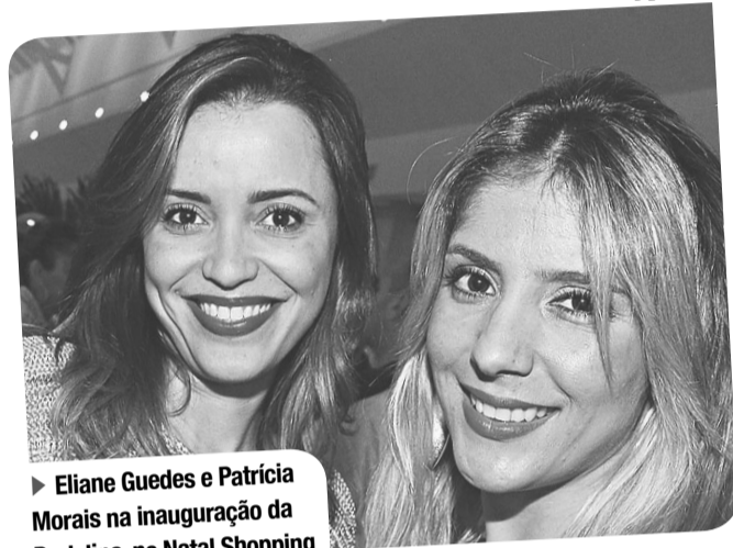
D'LUCA / NU