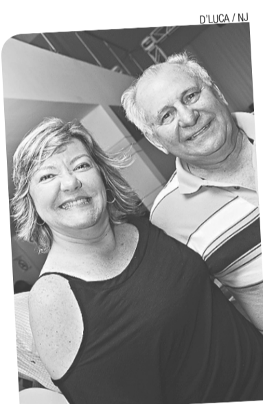
D'LUCA / NU

A Casa da Ribeira solicita aos grupos, coletivos e artistas que têm trabalhos direcionados ao público infantil, o envio de material para o banco de dados da Casa. O objetivo desta ação é criar um catálogo com espetáculos, oficinas e atividades lúdicas para crianças, no intuito de convidá-los para as próximas edições do Circuito Cultural Ribeira, com direito a ajuda de custo de R$500, ou em outras atividades do espaço. Mais informações no 3211-7710.