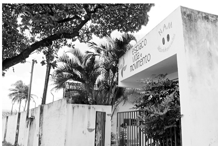
► Registrado no Conselho Nacional de Assistência Social o Núcleo de Amparo ao Menor de Felipe Camarão realizou mais de 80 mil atendimentos desde 2008

“A nossa principal filosofia é de integração. O pessoal costuma individualizar, restringir o acesso. Nós não, o nosso espaço é para a comunidade. As portas estão abertas para toda a comunidade, não só para o que queremos desenvolver aqui”, explica.