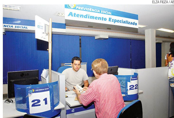
► O benefício será pago pelo INSS, que não pode contestar decisão

A decisão, no entanto, não significa que o direito ao salário-maternidade é extensivo a todos os pais que se enquadrarem em si-