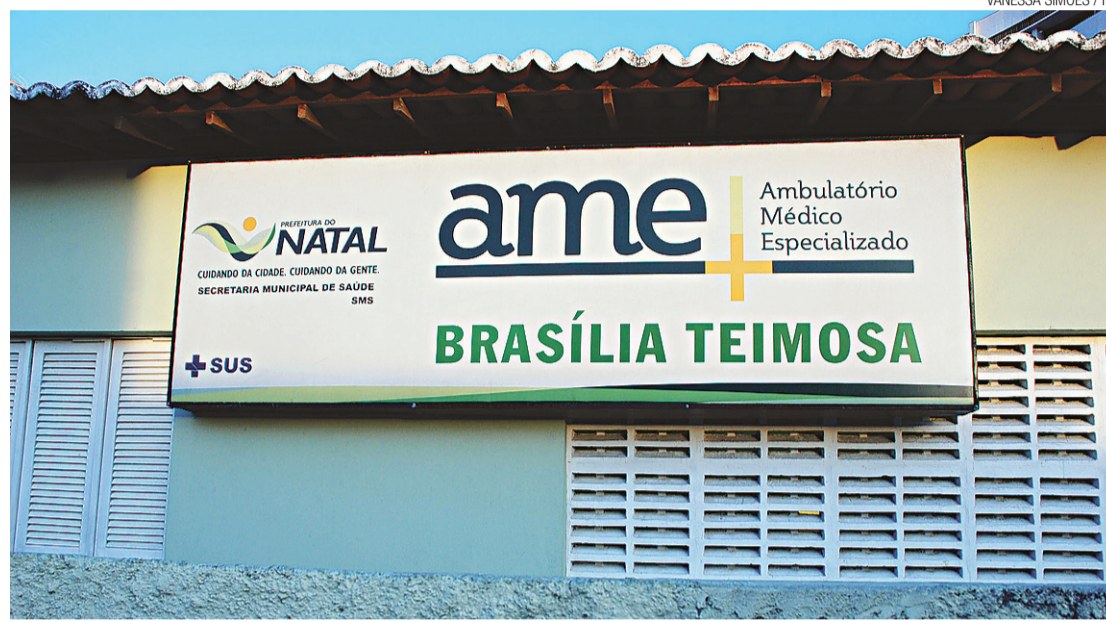
► Juiz entendeu que R$ 690 mil são recursos prioritários para manter funcionamento das unidades de saúde