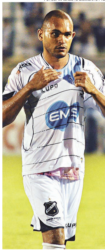
▶ Washington tinha o maior salário

Para complicar ainda mais a situação do clube, o atacante já atuou em sete partidas e não pode mais jogar a série B por outro time, inviabilizando um possível empréstimo. O prejuízo só não é maior porque, segundo