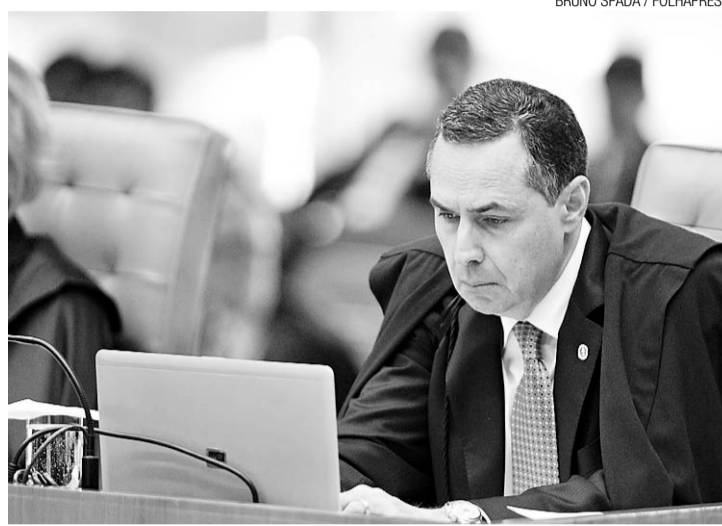
▶ Luís Roberto Barroso foi o primeiro a votar a favor dos réus

Ele aproveitou um raciocínio do ministro Ricardo Lewan-