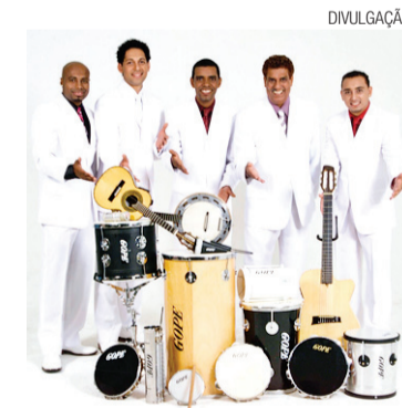
► Os Originais do Samba: uma das atrações no polo das Rocas