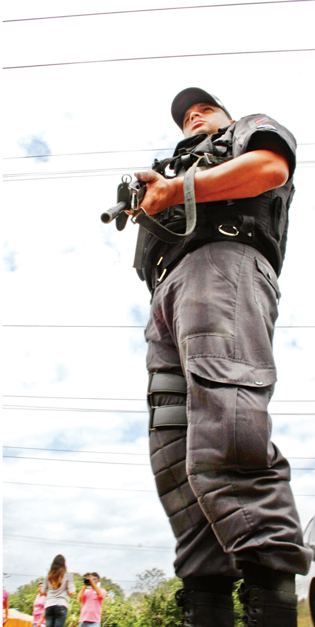
▶ Efetivo extra da PM será composto por policiais que estariam de folga, sem prejuízo das escalas convencionais