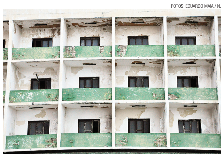
▶ Detalhe da fachada do Hotel Reis Magos, completamente deteriorada