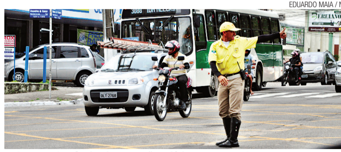
▶ Agentes de trânsito: intervenções viárias no carnaval