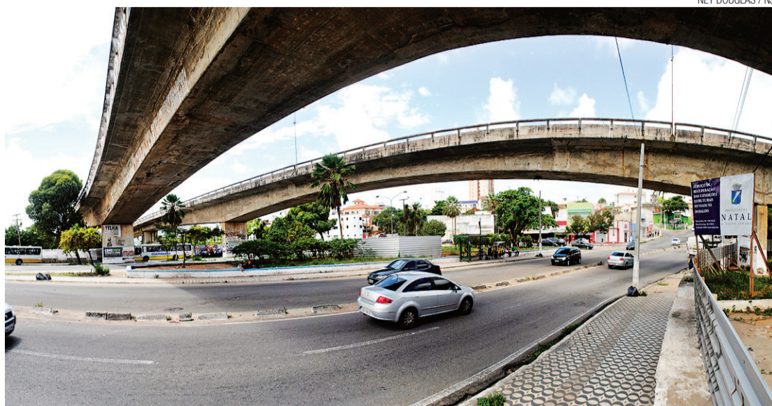
▶ Avenidas Deodoro e Rio Branco, no trecho abaixo do Viaduto do Baldo: laudo pode evitar interrupção do trânsito